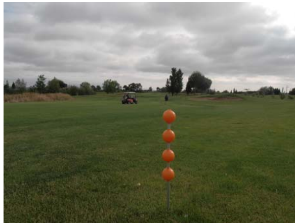
Estaca de 200 m.